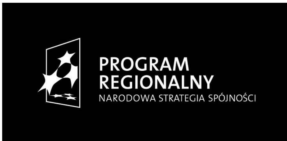
Ryc.11. Logo Narodowej Strategii Spójności - wariant achromatyczny, czarny, negatyw