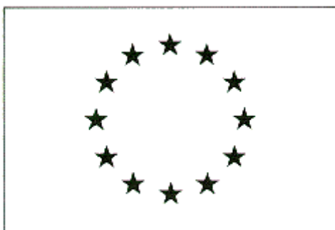
Ryc.3. Reprodukacja jednobarwna emblematu Unii Europejskiej w kolorze czarnym