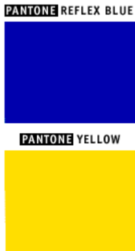
Ryc.2. Kolory znaku graficznego Unii Europejskiej