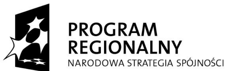
Ryc.10. Logo Narodowej Strategii Spójności - wariant achromatyczny, czarny, pozytyw